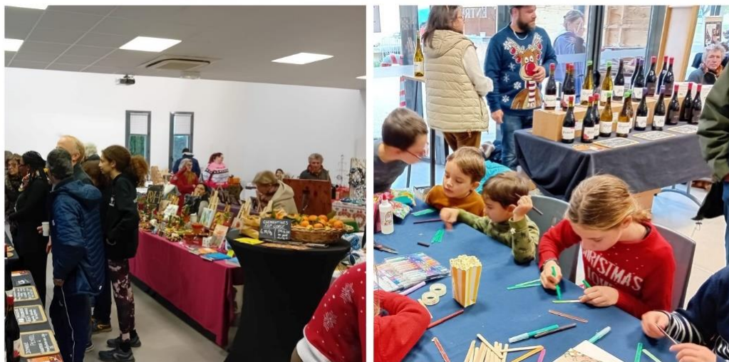
Photos marché de Noël 2023

Nous vous donnons rendez-vous sur la page face book Lesmarchesderousset pour suivre la mise à jour de notre programme.